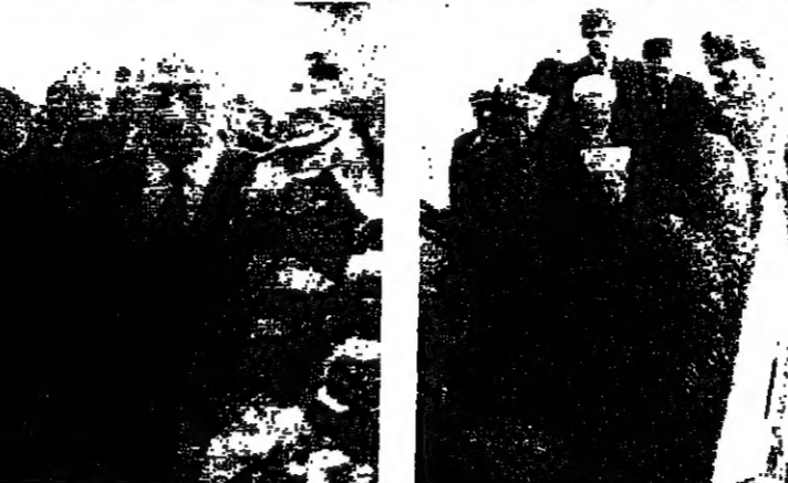
التوجه الى صالون الشرف